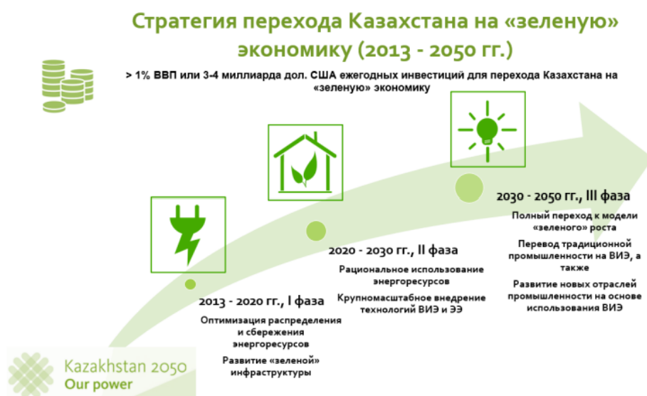
Рисунок 3 - Краткое описание этапов стратегии перехода к «зеленой» экономике в Казахстане

Основная стратегия перехода к «зеленой» экономике делится на 3 основных этапа: (i) этап I, 2013–2020 гг., (ii) этап II, 2020–2030 гг. и (iii) этап III, 2030–2050 гг., как показано на рисунке 3 ниже.